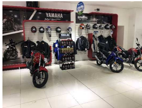
←販売店のディスプレイ