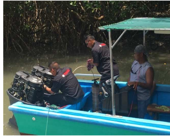
↑コスタリカでのサービスキャンペーン風景

今後も中南米・カリブ地域のお客様がヤマハ発動機製品を使うことに喜びを感じ、満足していただけるよう、これらの活動をさらに強化してまいります。